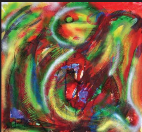
E. N. / Figura 5 / 200 x 100 cm / akryl, textil / 2010

Galerie v zahradě představuje práce Evy Novákové a Dagmar Petrovické. Dvou mladých paralelně tvořících studentek z ateliéru Skla na Univerzitě J. E. Purkyně v Ústí nad Labem.