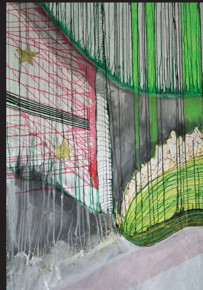
D. P. / SCENE 4 / 160 x 130 cm / kombinovana technika, papir / 2011