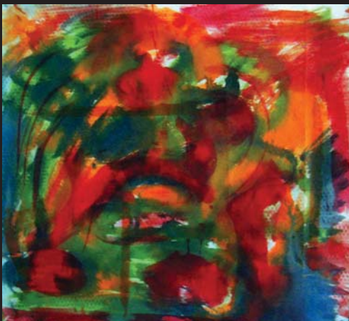
E. N. / Figura 3 / 200 x 100 cm / akryl, textil / 2010