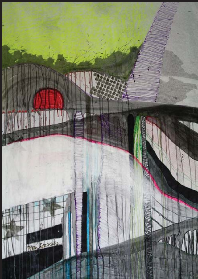
D. P. / SCENE 1 / 160 x 130 cm / kombinovana technika, papir / 2011