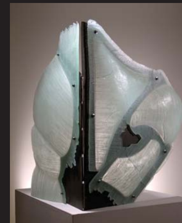
D. P. / VITRÁŽ / 80 x 70 cm / stavované, lehané sklo, kov / 2010

2011 Festival uměleckého skla, Galerie Minea, Karlovy Vary