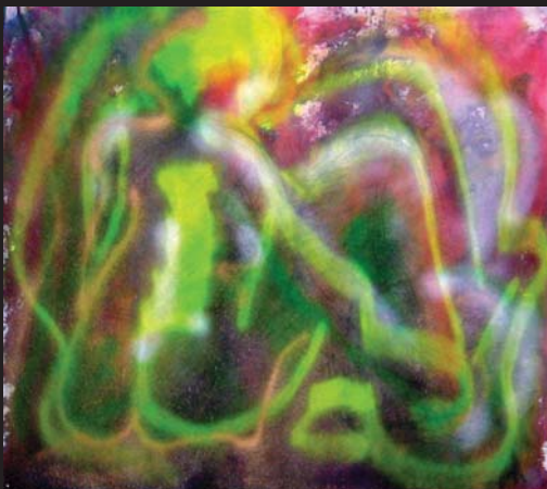
E. N. / Figura 4 / 200 x 100 cm / akryl, textil / 2010